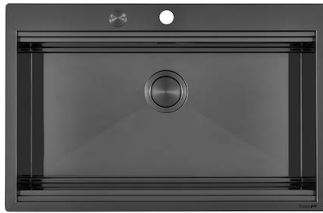
Fregadero Milanello Gun Metal workstation