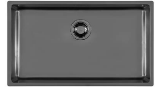
Fregadero KE Filotop Gun Metal